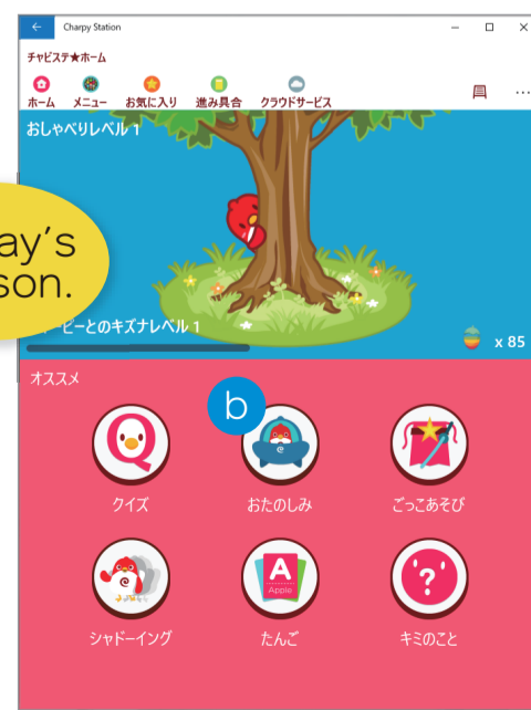
Windows 版 ホーム画面